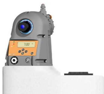
Montagem horizontal (standard)

Alimentação standard 230 VAC (opcional 12 – 24 VDC)