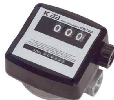
Série K 33