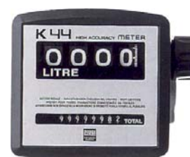
Série K 44